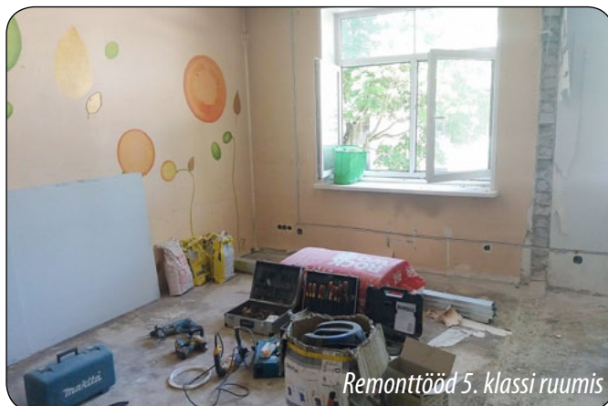
Remontitööd 5. klassi ruumis

Kogudusele kuuluva kinnistu ( Tehnika 81 , Tallinn) tänavapoolsele alale paigaldati uus piirdeaed koos väravatega .